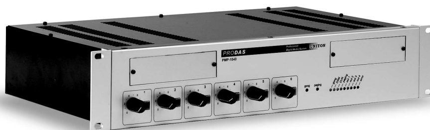
PMP-1040 avec/con US-020