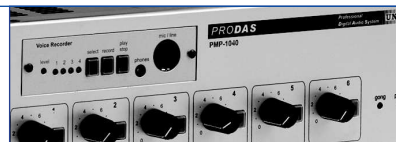
PMP-1040 avec/con DVR-400