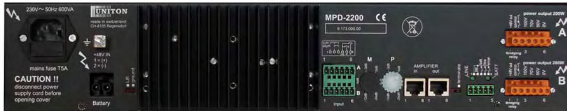
Face arrière Dietro MPD-2200