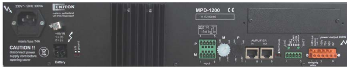
Face arrière Dietro MPD-1200