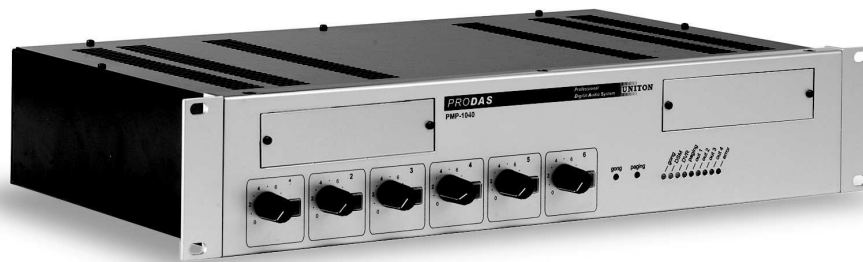
PMP-1040 mit/with US-020