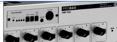
PMP-1040 mit/with DVR-400