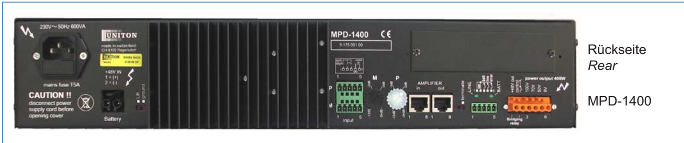
Rückseite Rear MPD-1400